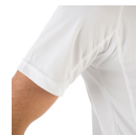
Detalle costura, corte manga y costado.