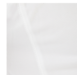
Detalle muestra tejido.